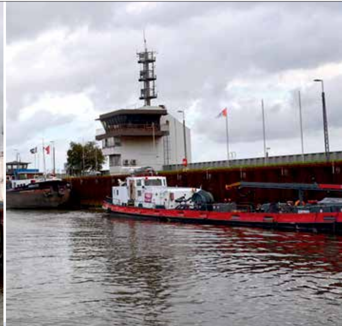
Facetten der bremischen Häfen mit ihren unterschiedlichen Anforderungen, Herausforderungen und ihrem Potenzial stets im Blick.

den Gesamthafen, wobei wir wiederum von der Küstenwache auditiert werden“, erläutert der Hafenkaptän.